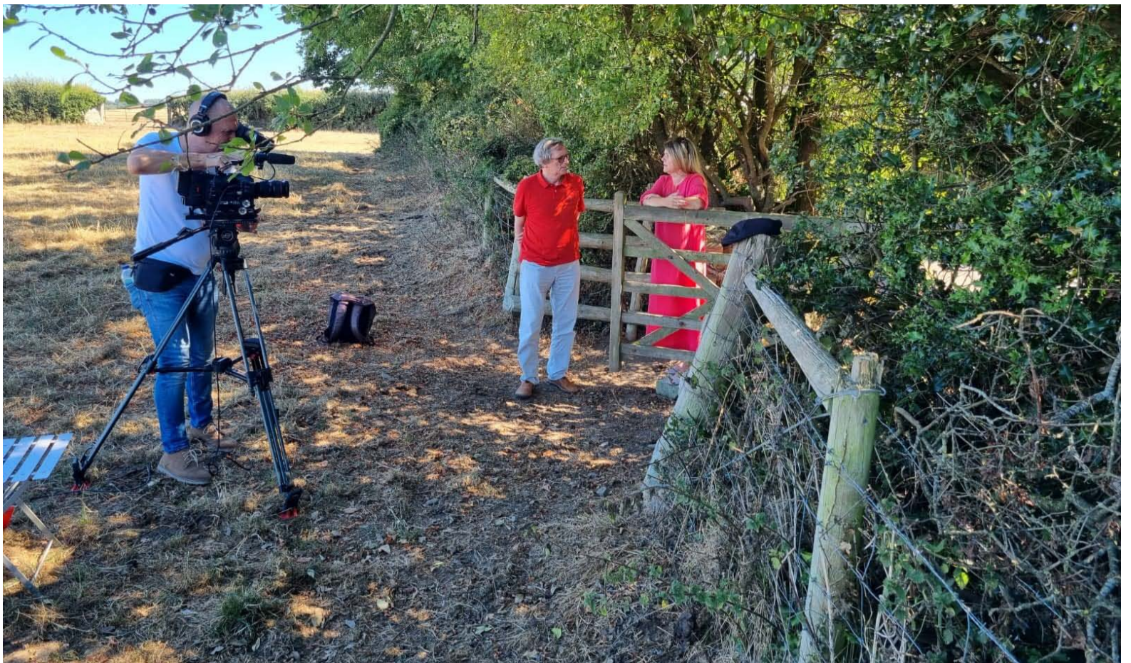
Zdjęcia na Trossell Farm w Kornwalii.

Zamiast tego następowały kolejne katastrofy – wybuch wojny, obóz koncentracyjny, Pawiak, wyrok śmierci – i kolejne cudowne ocalenia. Z tych czasów, jak sama mawiała – wyszła w najgorszej formie fizycznej, ale najlepszej duchowej. I z tych czasów zapamiętamy Zofię, która pisze broszury i ulotki, ratuje Żydów (słynna „Zegota” to jej dzieło), mówi: „Jeśli jesteście Panu Bogu potrzebni, to On nas prze-