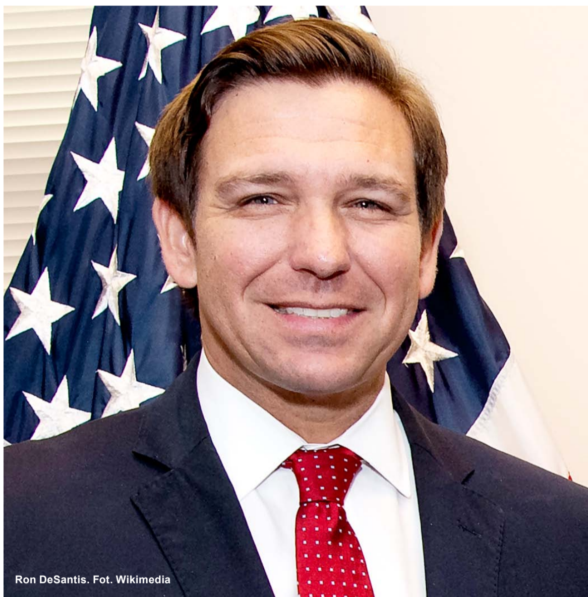
Ron DeSantis.

Gubernator Florydy i być może przyszły prezydent USA przeforsował ostatnio w stanowej legislaturze i podpisał kilka ważnych ustaw. W połowie kwietnia podpisał ustawę zakazującą aborcji po sześciu tygodniach ciąży, czyli mniej więcej – jak mówią znawcy – gdy po raz pierwszy można wykryć bicie serca dziecka. Podpisał nowe prawo zaostrzające kary za najcięższe przestępstwa. Na przykład gwałciciel dzieci kwalifikują się do kary śmierci z minimalnym wyrokiem dożywocia bez możliwości wcześniejszego zwolnienia. Na początku maja przyjęto na Florydzie ustawę zakazującą korzystania w szkołach czy restauracjach z ubikacji i łazienek w oparciu o tzw. tożsamość płciową. De-