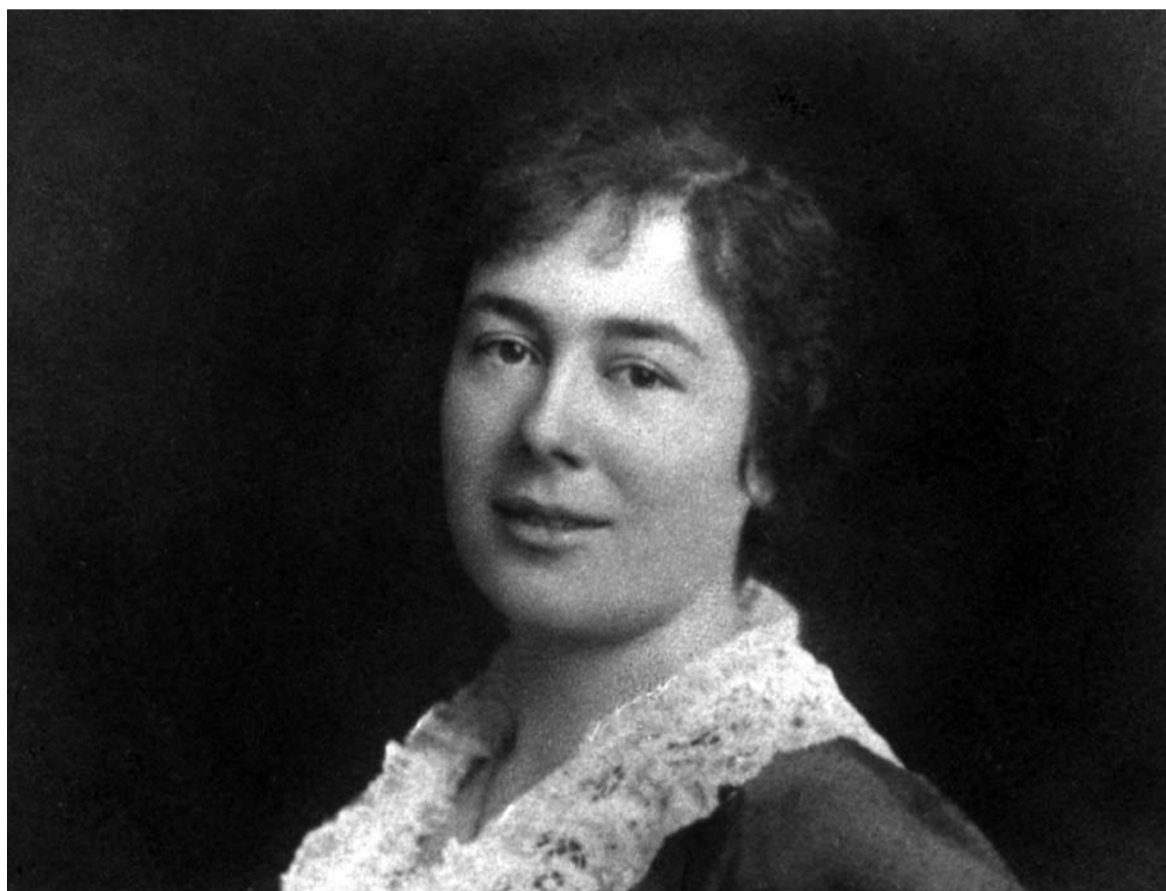
Zofia Kossak

Urodziła się nad krętą i pozornie tylko spokojną i leniwie płynącą rzeką, a rzeka ta może być symbolicznym opisaniem jej życia, które było pełne niespodziewanych zakrętów, gwałtownych zwrotów akcji, chociaż zaczę-