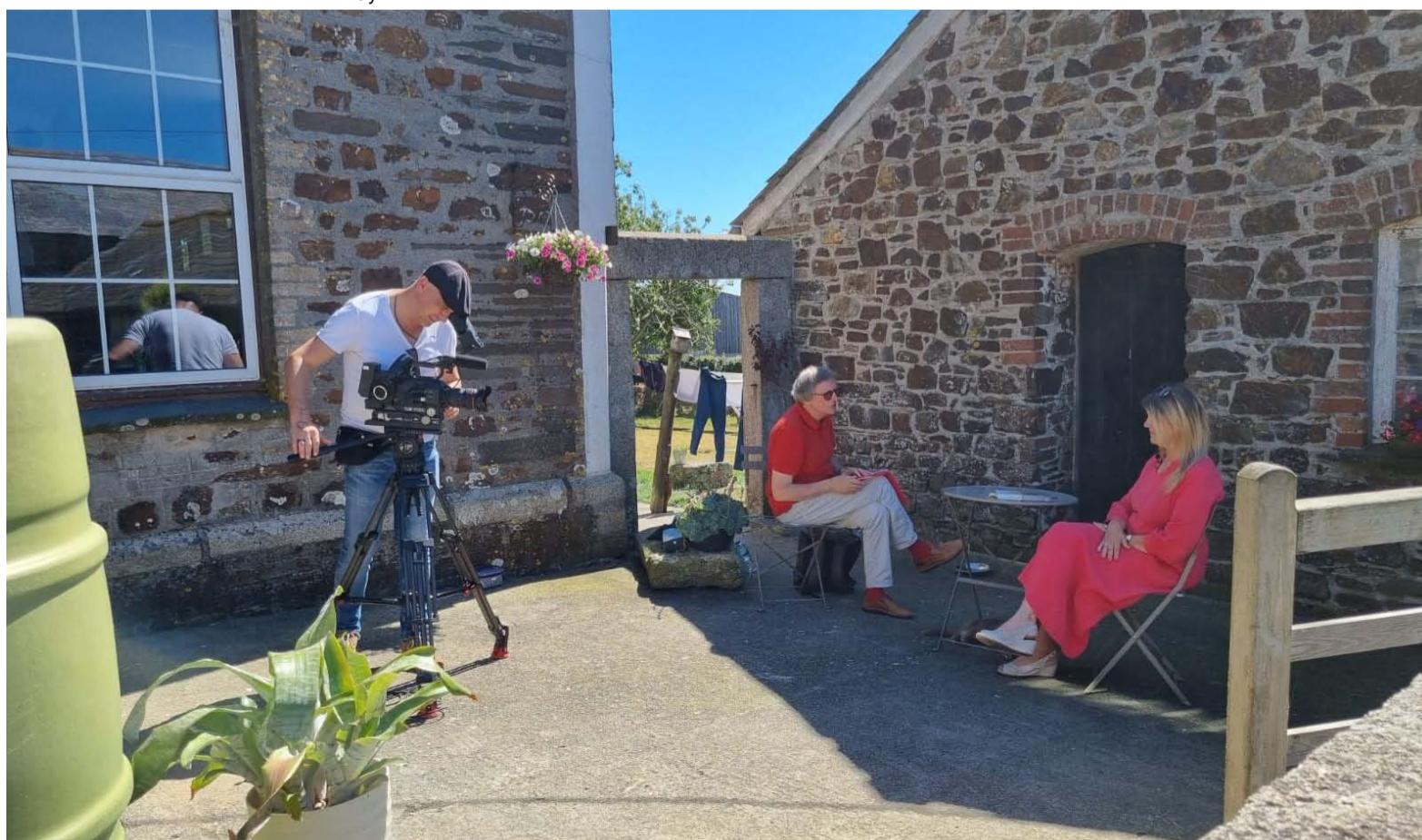
Na Trossell Farm w Kornwalii.

Często, wspominając Zofię Kossak mówi się o tym, że pochodziła ze znanej rodziny malarzy i literatów (dziadkiem był Juliusz Kossak, bliźniaczym bratem jej ojca – Wojciech; kuzynem – Jerzy; kuzynkami Lilka: Maria Pawlikowska-Jasnorzewska i Madzia: Magdalena Samozwaniec); ale zapomina się, że dziedziczyła i talent, i urodę. Kossakowie byli postawni i przystojni, a żona Juliusza, Zofia z Gał- ▶