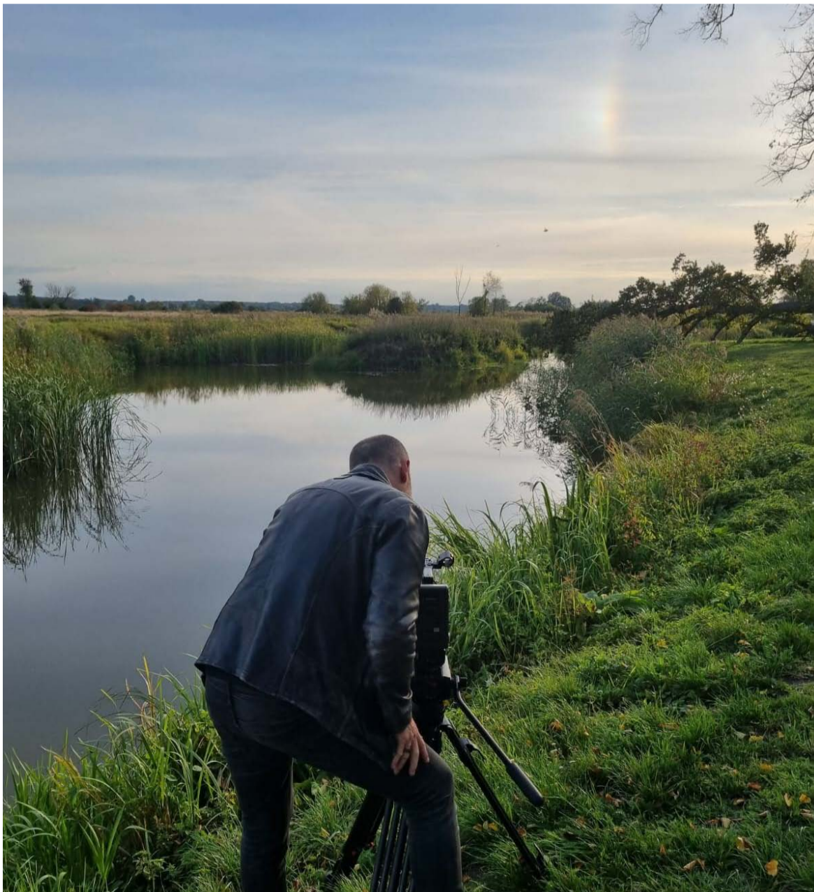
Nad Wieprzem na Lubelszczyźnie.