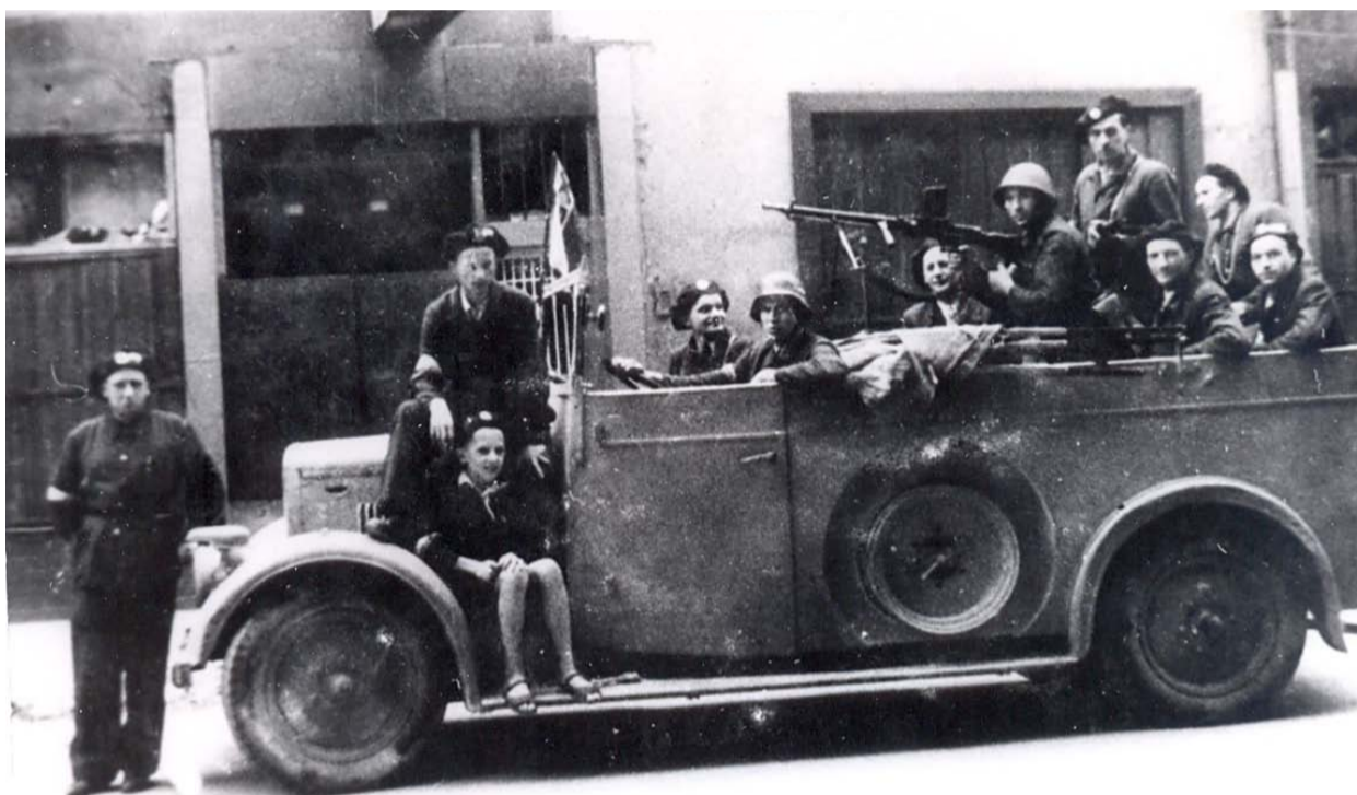
Żołnierze Oddziału Osłony Dowódcy Powstania Warszawskiego w pierwszych dniach Powstania Warszawskiego.